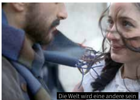
Die Welt wird eine andere sein

Lebensmut zu verlieren. Bewegend und inspirierend zugleich ist HIMMEL ÜBER DEM CAMINO eine wunderbare Geschichte über Menschen wie du und ich, die Außerwöhnliches vollbringen. Eine Geschichte über das Leben, die Liebe und den Verlust.