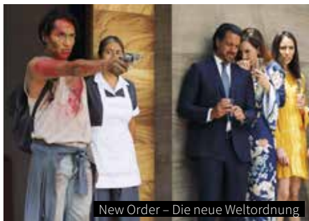
New Order – Die neue Weltordnung