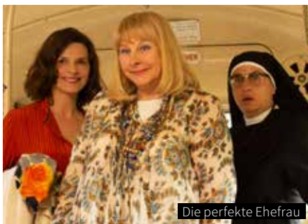
Die perfekte Ehefrau