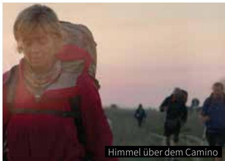
Himmel über dem Camino

Sie sind zwischen Anfang fünfzig und Mitte siebzig – die sechs Pilger, die gemeinsam die lange Reise von Frankreich ins 800 Kilometer entfernte Santiago de Compostela antreten. Ihre Intentionen dafür sind so unterschiedlich wie ihre Persönlichkeiten und ihre Lebensumstände. Für alle bedeutet der „Camino“ – so die spanische Bezeichnung des Jakobsweges, auf Deutsch: Straße oder Weg – etwas anderes. Julie hat ihren Mann und kurz darauf ihren Sohn verloren, sie möchte ihre Trauer verarbeiten, ähnlich ist es bei Mark, dessen Tochter gestorben ist. Er ist mit Terry verwandt, der den Weg zum zweiten Mal geht, so wie Claude, die am liebsten alleine geht. Cheryl liebt das Wandern und das Bergsteigen. Sie betrachtet den Jakobsweg vor allem als sportliche Herausforderung. Und da ist Sue, die sich vorgenommen hat, trotz ihres Rückenleidens und der Last ihrer 70 Jahre den gesamten Weg zu gehen. Ein berührender Film darüber, wie man lernt mit Trauer zu leben, ohne den