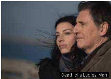
Death of a Ladies' Man