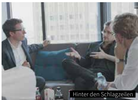
Hinter den Schlagzeilen